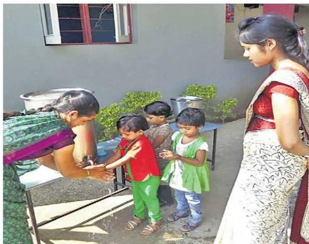
विवेकानंद स्कूल में नन्हे बच्चों के हाथ धुलाए गए।

जिले की 228 शालाओं में एक साथ हुआ आयोजन, जनप्रतिनिधि, अधिकारी और कर्मचारियों ने भी लिया भाग