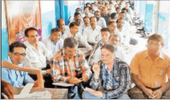
आजाद नगर में हाथ धुलाई के लिए प्रशिक्षण लेते शिक्षक।

आजाद नगर। 15 अक्टूबर को हाथ धुलाई दिवस के अवसर पर एक साथ हाथ धुलाकर विश्व रिकॉर्ड बनाने के लिए विकासखंड की चयनित प्राथमिक एवं माध्यमिक 50 शालाओं के बच्चे हाथ धोने के तरीके सिखेंगे।