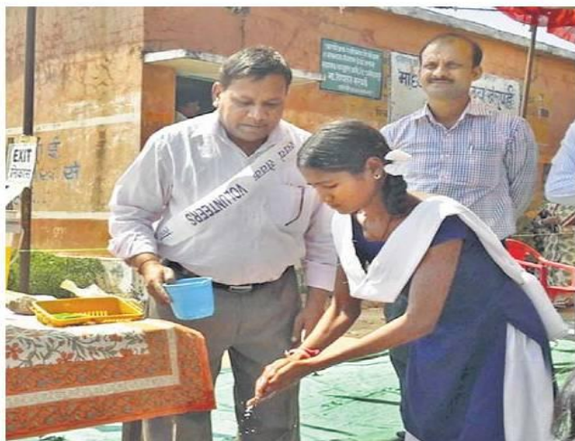
जिला पंचायत सीईओ ने खरपई में बच्चों के हाथ धुलाए।